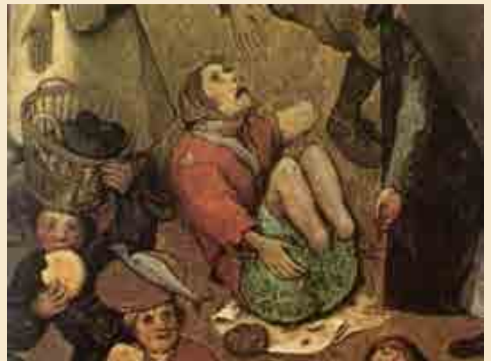
Antoniusfeuer, Pieter Brueghel der Ältere, ca. 1559