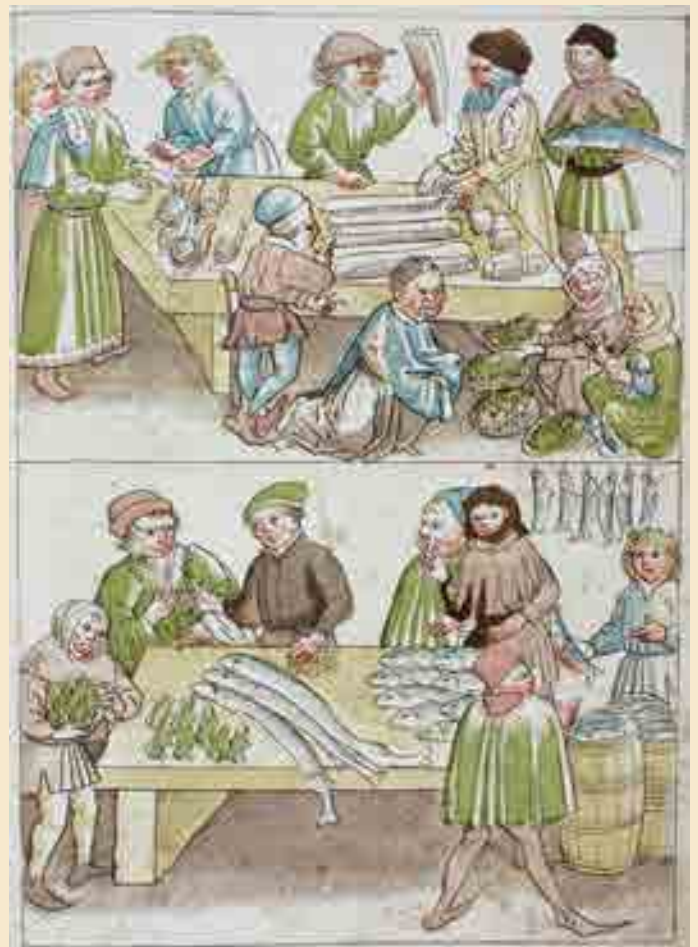
Verkauf von von Fischen, Fröschen und Schnecken, Konstanzer Richental Chronik, 1464

Bäuerliche Haushalte schlachteten im Herbst einen Teil des Viehs, da das Futter nicht ausreichte, um alle Tiere über den Winter zu bringen. Das so gewonnene Fleisch wurde geräuchert. Dabei werden die zuvor eingesalzenen Stücke in den Rauch von Holzfeuern gehängt.