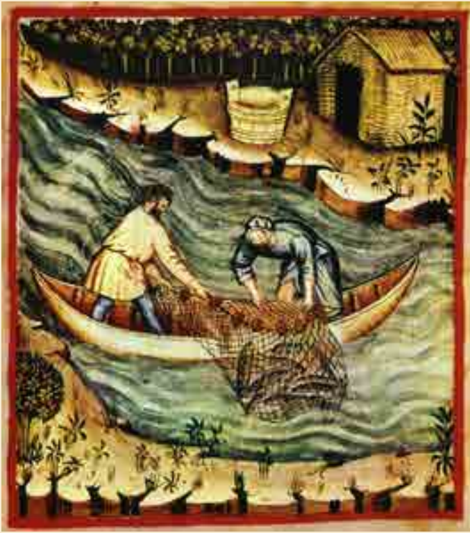
Fischerei, Tacuinum Sanitatis, 15. Jahrhundert