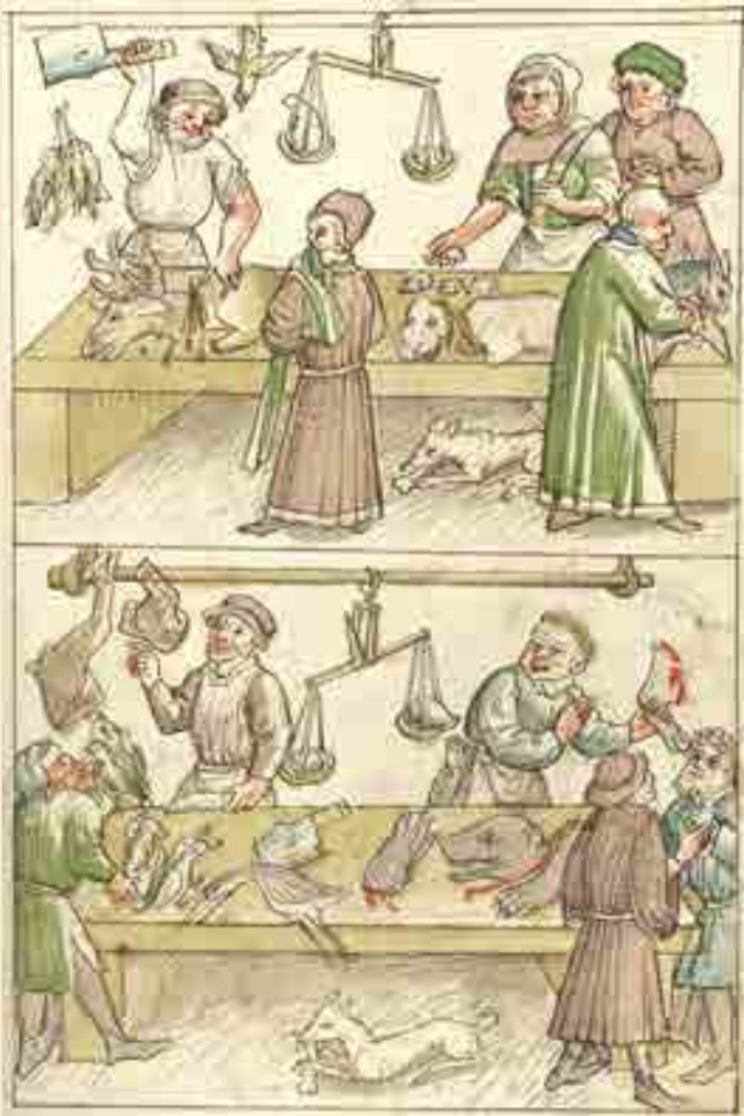
Verkauf von Fleisch, Konstanzer Richental Chronik, 1464