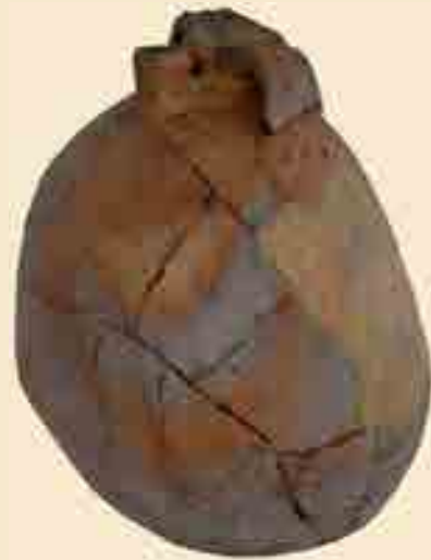
Flasche aus Ton, 13. Jh.

Die Darstellung im Model zeigt einen stehenden Mann in reicher, spanischer Renaissancetracht. Eigentum des Heuson-Museums Büdingen