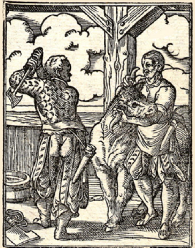
Metzgermeister und Geselle bei der Schlachtung aus: Eygentliche Beschreibung aller Stände auff Erden, hoher und nidriger, geistlicher und weltlicher, aller Künsten, Handwercken und Händeln ...“ Holzschnitt auf Papier, von Jost Amman and Hans Sachs, Frankfurt am Main, 1568