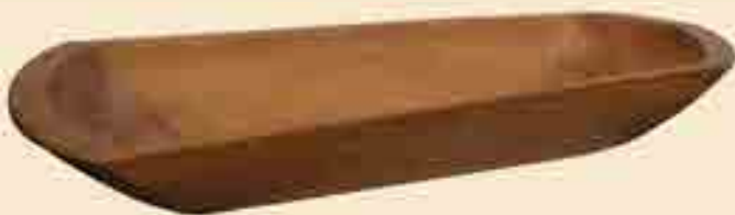
Bütte, Holz, 19. Jh.

Bei allen drei ist Form und Material vom Mittelalter bis in die Neuzeit gleichgeblieben.