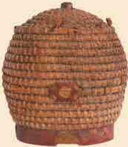
Bienenkorb aus Stroh und Holz, um 1800? Form und Herstellung der Bienenkörbe ist vom Mittelalter bis in die Neuzeit nahezu gleichgeblieben. Eigentum des Heuson-Museums Büdingen