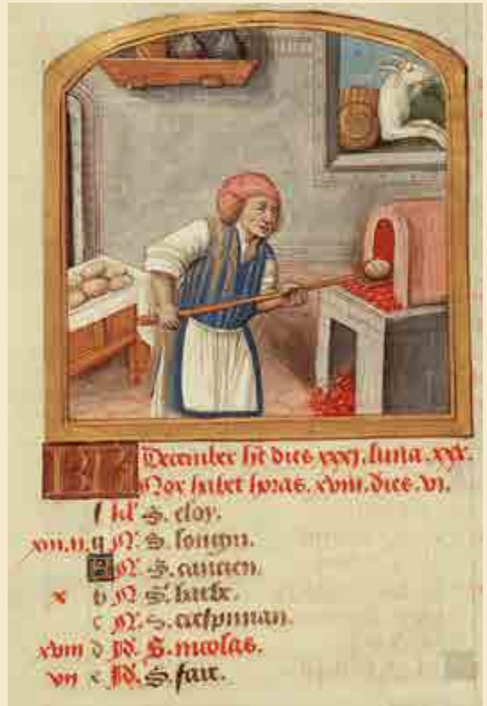
Mittelalterliches Monatsbuch (Dezember) aus einem Kalendarium

Mit Bäckerschupfen oder Bäckertaufe wurde bestraft, wer Brot mit zu geringem Gewicht oder schlechter Qualität verkaufte. Dabei wurde der Verurteilte in einem Schandkorb oder mit einer Wippe ins Wasser oder in Dreck getaucht, mit Steinen beworfen und gedemütigt.