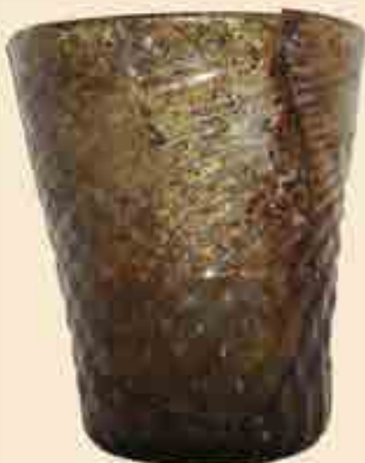
Maigelein, grünliches Hohlglas in Becherform mit kegelförmig eingestochenen Boden, ca. 2. Hälfte 15. Jh. Weit häufiger verbreitet sind napf- und schalenförmige Maigelein. Das Gefäß wurde bei der Fertigung in eine Form gepresst, so dass eine Verzierung mit Kreuzrippen entstand. Glashütten standen wegen des hohen Holzverbrauchs häufig in Waldgebieten und wechselten meist nach etwa zehn Jahren den Standort. Fundort: Burgruine Hardeck, Leihgabe des Stadtarchivs Büdingen.