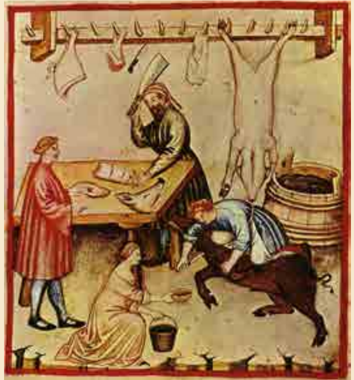
Schlachtereie, Tacuinum Sanitatis, 15. Jahrhundert

Hühner, Gänse und Enten waren ebenfalls beliebte Fleischlieferanten, Huhn war für die ärmere Bevölkerungsschicht das am ehesten erschwingliche Fleisch.