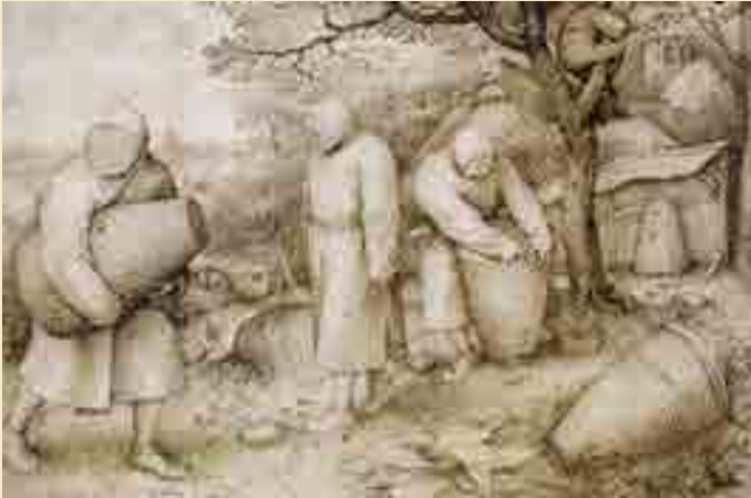
Bäuerlicher Bienenstand, Kupferstich von Jan van der Straet, 16. Jahrhundert