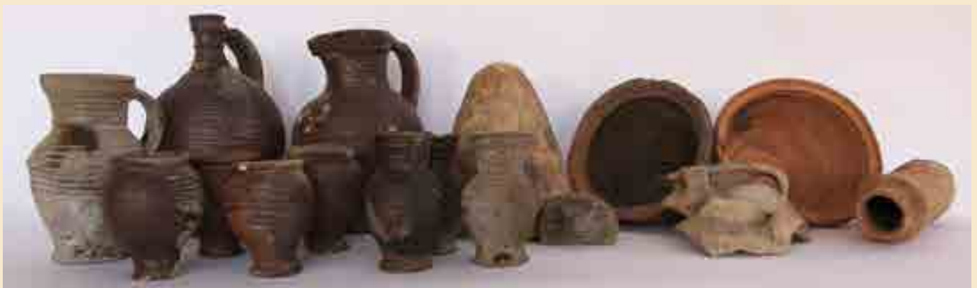
Töpfereifunde, Irdenware und Faststeinzeug, 13./14. Jh.

C. Krauskopf, Die mittelalterliche Töpfereitradition in Aulendieb- bach, in: Büdinger Geschichtsblätter Bd. XV, 1995-96, 305-311. P. Hanauska/ T. Sonnemann, Spätmittelalterliche Keramik- produktion „manganvioletter Ware“ im Rheingau – und um den Rheingau herum, in: hessenArchäologie 2013, 2014, 174-177.