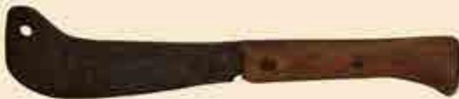
Spalter, Holz und Eisen, 19. Jh.,