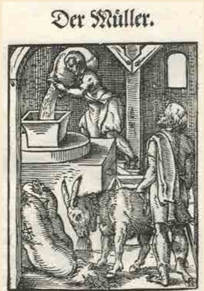
Der Müller aus: Eygentliche Beschreibung aller Stände auff Erden, hoher und nidriger, geistlicher und weltlicher, aller Künsten, Handwercken und Händeln ...“ Holzschnitt auf Papier, von Jost Amman and Hans Sachs, Frankfurt am Main, 1568

Aufgrund des hohen Wertes für die Allgemeinheit wurden Diebstähle am Getreide und an der Einrichtung der Mühle mit besonders harten Strafen geahndet ( Mühlenfrieden ).