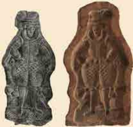
Gebäckmodell aus Ton, graphitiert, 2. Hälfte 16. / Anfang 17. Jh. und ein moderner Bleiabguss.

Die Darstellung im Model zeigt einen stehenden Mann in reicher, spanischer Renaissancetracht. Eigentum des Heuson-Museums Büdingen