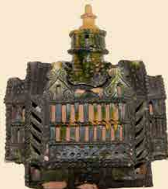
Lavabo, Steingut, olivgrün und senfgelb glasiert, 16. Jh. Wasserbehälter in Hausform zum Aufhängen aus zwei Teilen. Der kleine Turm ist zum Befüllen abnehmbar. Das Ausgussrohr fehlt, ebenso die separate Wasserauffangschale.

Fundort: Töpferei Aulendiebach Eigentum des Heuson-Museums Büdingen