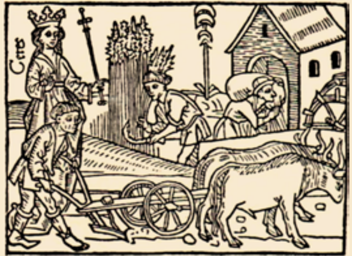
Pflügender Bauer, Ernte und Transport von Getreide zur Mühle, Holzschnitt von 1473