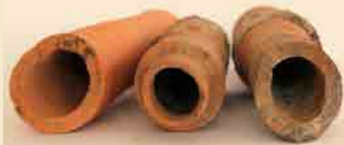
Wasserleitungsrohre aus Ton, 14./15. Jh. Die ersten Wasserleitungen waren aus Holz und mit Eisenringen verbunden. Die tönernen Röhren wurden so hergestellt, dass die Leitungsstücke ineinander gesteckt werden konnten.

Brunnenteile verschiedener Brunnen sind sowohl im Heuson-Museum, als auch im Lapidarium hinter dem Museum zu sehen.