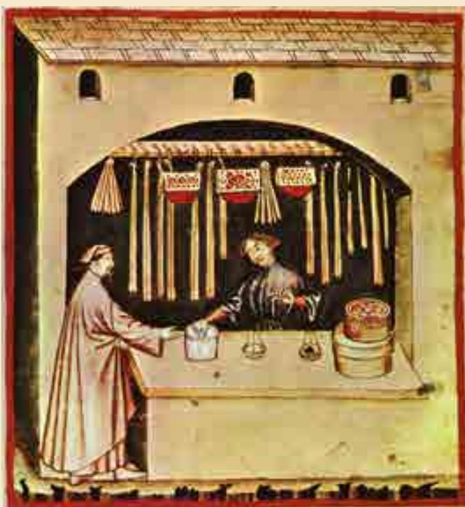
Kauf von Zucker, Tacuinum Sanitatis, 15. Jahrhundert