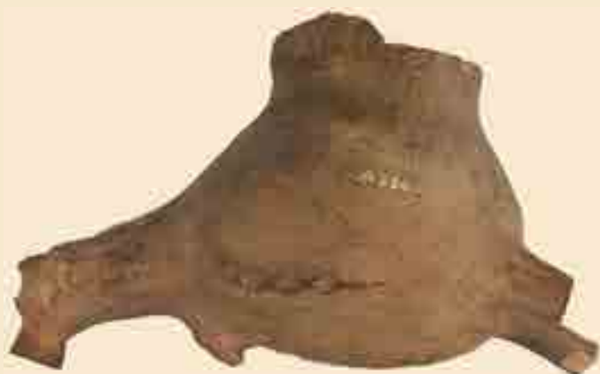
Aquamanile (Handwaschgefäß) aus Ton, 14. Jh. Die Handhabe und die Füße fehlen. Der Ursprung dieser Gefäße ist der Orient. Sie wurden durch die Kreuzfahrer nach Europa gebracht und dienten zur Handwaschung vor den Mahlzeiten.

Leihgabe des Heimat- und Geschichtsvereins Glauburg.