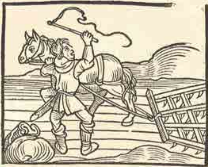
Ackerbau & Pferd & Egge, Jacob Koebel 1598, Holzschnitt auf Papier

Pflügen dient dem Lockern und Wenden der Ackerkrume. Der Boden wird durchlüftet, was die Humusbildung beschleunigt. Der Pflug wurde bereits in prähistorischer Zeit eingesetzt, seine Form - und damit seine Wirksamkeit - hat sich seither aber stark verändert. Zunächst zogen Menschen oder Ochsen den Pflug, später die wesentlich kräftigeren und wendigeren Pferde.