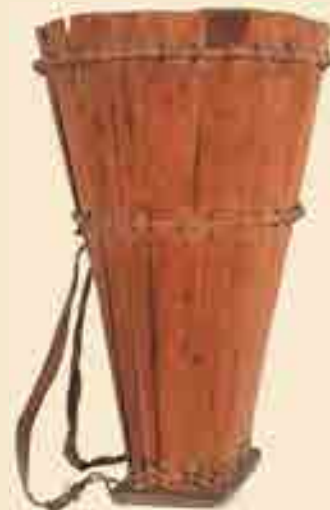
Kiepe aus Holz, 19. Jh.? Auch die Form der Kiepe zur Weinlese aus Holz oder Weidengeflecht ist über Jahrhunderte nahezu gleichgeblieben. Eigentum des Heuson-Museums Büdingen