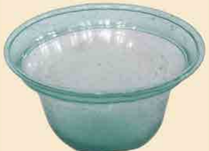
Tümmeler, gläserner Sturzbecher, Mitte 7. Jh., eine fränkische Sonderform mit rundem Boden. Fundort: Fränkisches Frauengrab, Büdingen-Düdelshcim. Eigentum des Heuson-Museums Büdingen