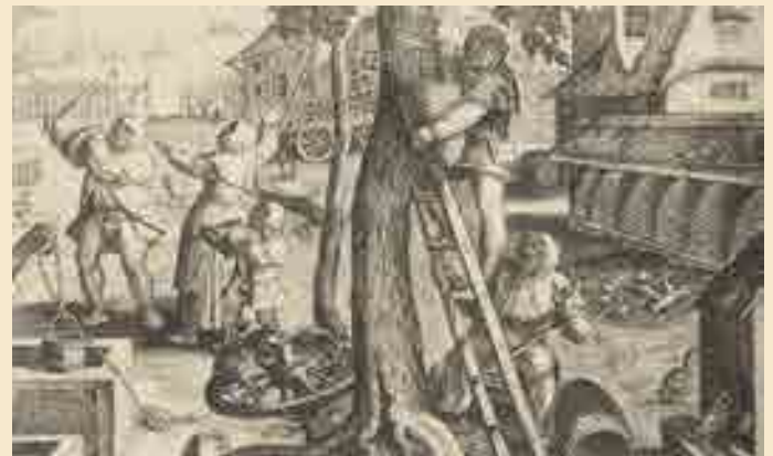
Die Bienenzüchter, Federzeichnung von Pieter Bruegel dem Älteren, um 1568

Ursprünglich wurden Bienenvölker aus hohlen Baumstämmen geholt oder die Baumstücke herausgeschnitten und an einem anderen Platz aufgestellt. Bei der Korbimkerei wurden den Bienen neue Nisthöhlen gegeben. Bei der Ernte von Honig und Wachs wurden die Waben herausgeschnitten. Die heutige Form der Bienenstöcke, bei denen der Imker Bienenwaben entnehmen kann, ohne das Bienenvolk zu schädigen, war unbekannt, die Honigernte bedeutete den Verlust des Volkes. Daher war Honig teuer.