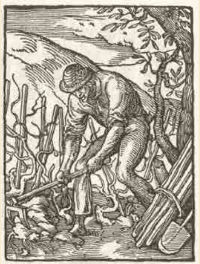
Der Rebmann aus: Eygentliche Beschreibung aller Stände auff Erden, hoher und nidriger, geistlicher und weltlicher, aller Künsten, Handwercken und Händeln ... Holzschnitt auf Papier, von Jost Amman and Hans Sachs, Frankfurt am Main, 1568