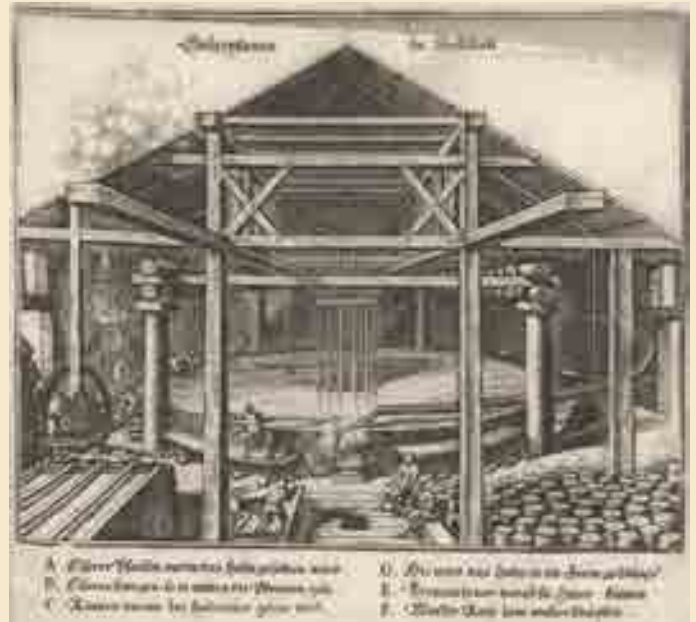
Die Saltzpan zu Hallstätt, Matthäus Merian, Topographia Germaniae 1679

Ein Gradierwerk bestand aus einem Holzgerüst, das mit Reisigbündeln verfüllt war. Das Solewasser wurde durch das Reisig geleitet und durch die Verdunstung des Wassers erhöhte sich der Salzgehalt. Danach wurde die Sole in Pfannen verdampft, es entstand das Sud- oder Siedesalz .