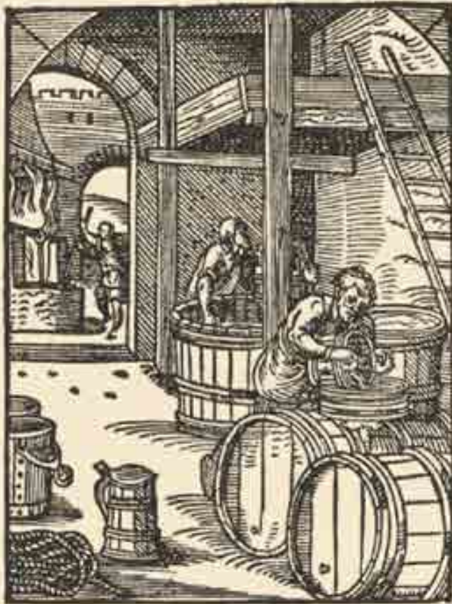
Der Bierbreuer aus: Eygentliche Beschreibung aller Stände auff Erden, hoher und nidriger, geistlicher und weltlicher, aller Künsten, Handwercken und Händeln ... Jost Amman and Hans Sachs, Frankfurt am Main, 1568