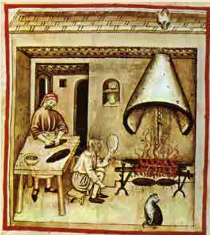
Küchendarstellung aus Tacuinum Sanitatis, 14. Jahrhundert