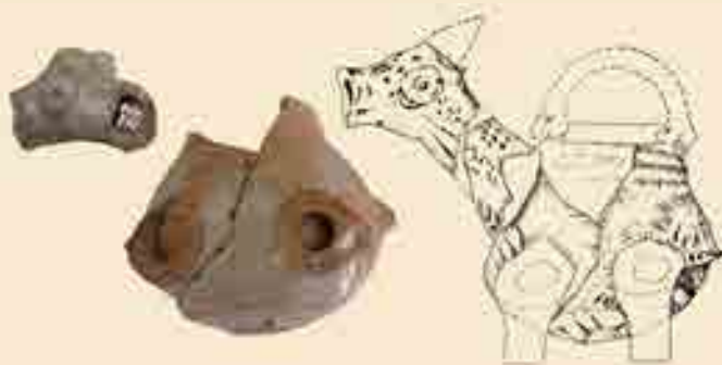
Zwei Bruchstücke eines Aquamanile, Ton, 13. Jh. Erhalten sind der Ausguss in Form eines Tierkopfes und ein Teil des Körpers mit dem Ansatz von zwei Beinen.

Büdingens älteste Wasserleitung führte in hölzernen Rohren vom Quellenbereich in der Nähe der Buntsandsteinbrüche „Am Hain“ zum Brunnen am historischen Rathaus, dem heutigen Heuson-Museum. Der restaurierte Brunnen befindet sich noch heute an der Westseite des Hauses. Entstanden ist er wahrscheinlich während des Rathausumbaus nach 1495, was durch eine Abrechnung von 1496 belegt wird.