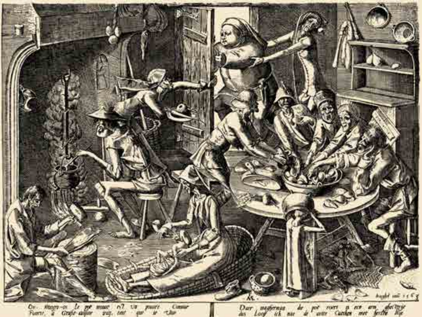
Die magere Küche, Pieter Bruegel der Ältere, 1563, Kupferstich

Getrockneter Kabeljau und gesalzener Hering gehörten ab dem 10. Jahrhundert zu den europaweit gehandelten Lebensmitteln, daneben wurde eine Vielzahl unterschiedlicher Arten von Süß- und Salzwasserfischen gegessen.