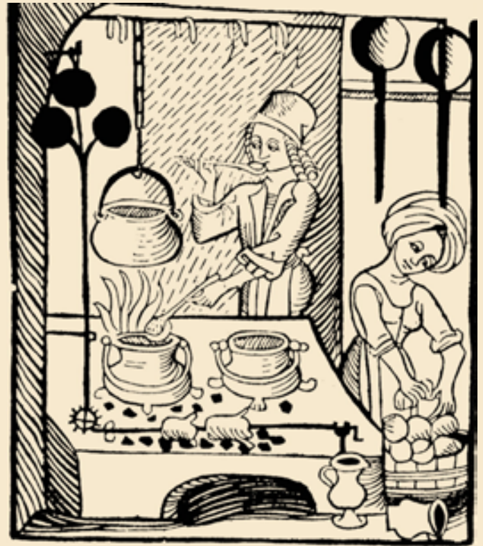
Küche mit Kachelofen, Dreifußtöpfen und Bratenspieß. Abb. aus der Kuchenmaistrey, Augsburger Ausgabe von 1505

Flache, aufgeschnittene Brotleibe dienten als Teller, gegessen wurde mit den Fingern, Löffeln und dem Messer. Die eigene Kleidung diente nach dem Essen dem Säubern der Finger.