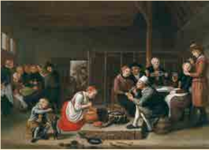
Bauernküche im Stall, Jan Victors, 17. Jahrhundert